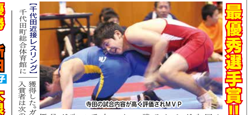
寺田の試合内容が高く評価されMVP

【優勝！新田男子大泉ギガ女子】 新田が41-35で逃げ切り優勝。女子決勝は大泉ギガスパークスと太田中央の対戦となり、両チームともポストプレーで得点を重ね、36-27で大泉が接戦を制した。