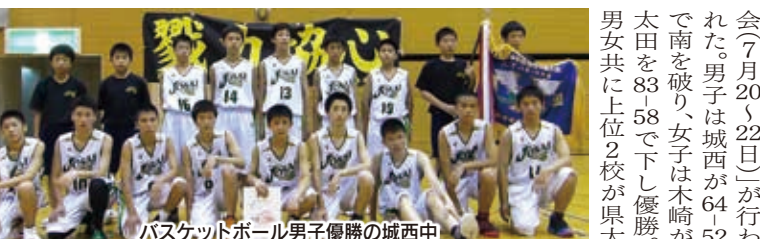
バスケットボール男子優勝の城西中

スポーツコム・ガンバでは地域の様々なスポーツ情報を募集しています。大会要項・結果・メンバー写真等をガンバ編集部までお送りください。なお、お送りいただいた写真等は返却できません。また、紙面の都合により掲載できない場合もありますので、ご了承ください。編集部から連絡する場合がありますので、必ず連絡先を明記してください。※わからない点がありましたら、ガンバHPの「お問い合わせ」か、編集部0276(30)5579までお気軽にお問い合わせください。