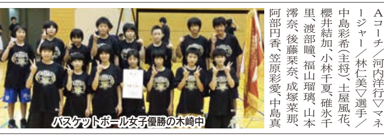
バスケットボール女子優勝の木崎中