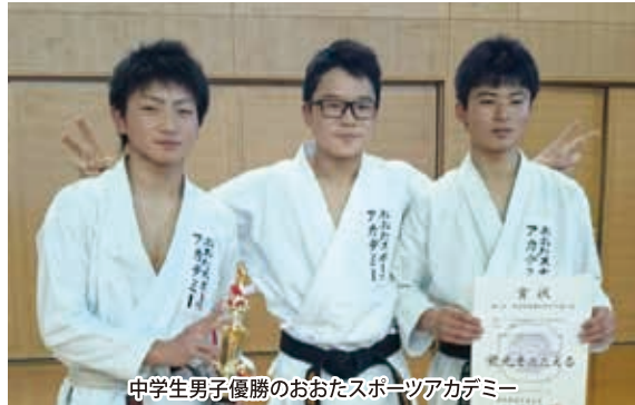
中学生男子優勝のおおたスポーツアカデミー

【県道場対抗空手道】前橋市のぐんま武道館で「第7回群馬県道場対抗空手道大会(2月1日)」が行われた。この大会は、小学生低学年から高校生以上までの男女が10部門に分かれて、組手団体戦をトーナメント方式で競う大会で、今回は、空手道場以外に学校の空手部も加わり合計139チームが参加した。