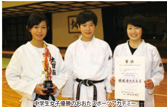
中学生女子優勝のおおたスポーツアカデミー

【県道場対抗空手道】前橋市のぐんま武道館で「第7回群馬県道場対抗空手道大会(2月1日)」が行われた。この大会は、小学生低学年から高校生以上までの男女が10部門に分かれて、組手団体戦をトーナメント方式で競う大会で、今回は、空手道場以外に学校の空手部も加わり合計139チームが参加した。