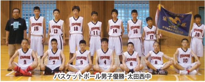
バスケットボール男子優勝・太田西中

【結果】軟式野球②館林四◇ソフトボール▷女子①宝泉②藪塚本町◇バスケットボール▷男子①太田西▷女子②木崎③館林三◇バレーボール▷男子①藪塚本町▷女子①毛里田②生品◇バドミントン▷男子③城西、木崎▷女子①藪塚本町③太田◇サッカー③休泊◇陸上競技▷男子②太田◇水泳▷男子③木崎▷女子②太田◇柔道▷男子③宝泉◇ダンス▷最優秀賞=太田北