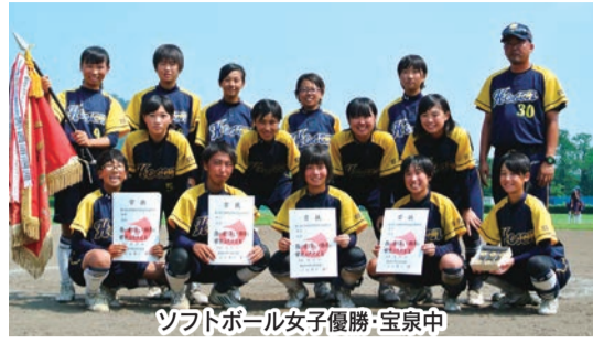
ソフトボール女子優勝・宝泉中

県内各会場で「平成27年度群馬県中学校総合体育大会（7月29日～8月1日）」が行われ、（ガンバエリアの）ソフトボール女子の宝泉、バスケットボール男子の太田西、バレーボール男子の藪塚本町、同女子の毛里田、バドミントン女子の藪塚本町が優勝を飾った。ダンスでは最優秀賞に太田北が選ばれた。団体3位までの結果は次のとおり。